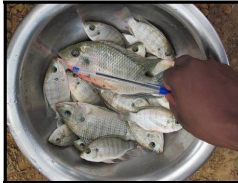
Echantillon de Tilapia prélevé d'un étang de l'Association Jigiya de Kayo au cours de la première période des essais à la ferme.