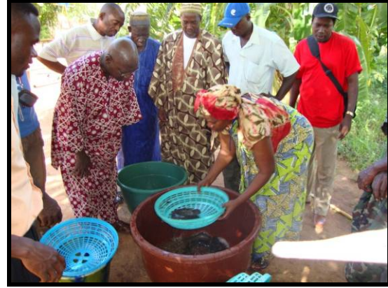
Les quatre Maliens qui ont été formés au Centre Aquacole de Sagana au Kenya sur la propagation du poisson-chat et la gestion d'une écloserie ont aidé dans les démonstrations des techniques de reproduction artificielle du poisson-chat pendant la session de formation de courte durée tenue à Sotuba en Juin 2009.