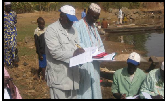
Collecte de données de l'enquête cadre au lac Sélingué.

Au début du mois d'Avril 2009, un système d'enregistrement et de gestion des données de l'enquête cadre a été développé. Après avoir entré toutes les données dans le système, le database a été revu électroniquement pour confirmer la présence de toutes les informations nécessaires, et les résultats ont été transférés dans un fichier MS Excel pour d'autres analyses.