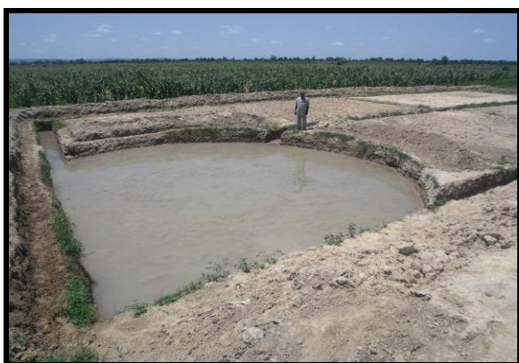
A Baguineda, ce champ a été préparé pour la rizipisciculture en creusant des canaux d'eau à l'intérieur de la parcelle qui mènent de part et d'autre vers un puisard aménagé dans l'un des coins. Le puisard sert de refuge pour les poissons.