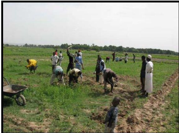
Préparatifs rizipiscicoles à Baguineda: Aménagement d'un puisard dans un coin d'une parcelle de riz.