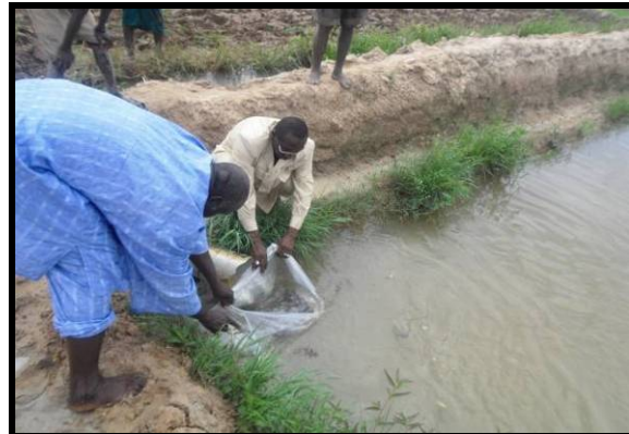
Déchargement des alevins dans un puisard dans une parcelle riz à Baguineda.