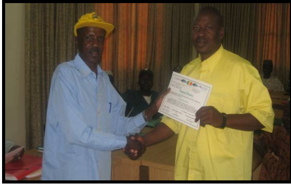
A la fin de la session de formation en Février 2009, chaque agent recenseur formé pour l'enquête cadre a reçu un certificat.