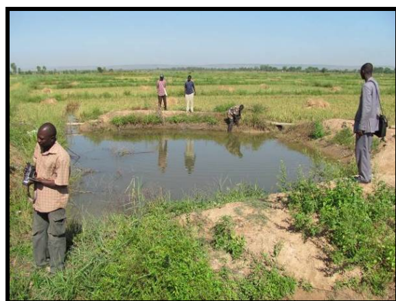
Une parcelle de riz à Baguineda au cours d'un cycle de production rizipiscicole. Le puisard est ici visible dans le coin le plus proche du champ. La récolte des quatre sites de démonstration aura lieu au cours du premier trimestre de l'année fiscale 2010.