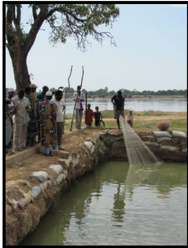
Gauche: Les membres de l'Association Jigiya de Kayo conduisent un échantillonnage de poissons par filet dans leur nouvel étang au cours du premier cycle des essais à la ferme, Juillet 2009 - Janvier 2010.

étudiants qui sont partiellement financés par le projet. La supervision comprend notamment des visites régulières (mensuelles) aux étangs pour évaluer leur état, et un enregistrement de données détaillées par date des espèces de poissons stockés, des poids de poissons prélevés au cours des pêches d'échantillonnage mensuelles, ainsi que les quantités et les coûts des intrants utilisés. Au moment de la récolte prévue en Janvier, les données finales sur la survie, la croissance et le rendement en poissons, ainsi que le revenu brut et net seront enregistrés. Après la récolte de tous les étangs, une session de travail finale sera tenue pour comparer et discuter les résultats de chaque étang.